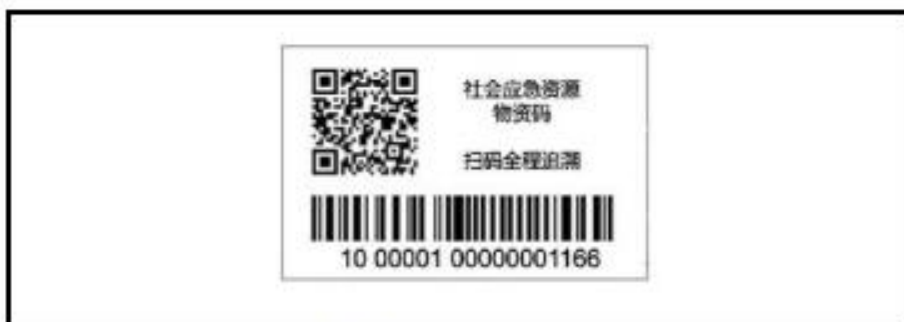
示例 2 产品标志耐久性标签